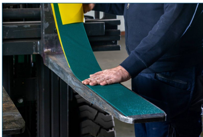
セキユグリップ シールタイプ