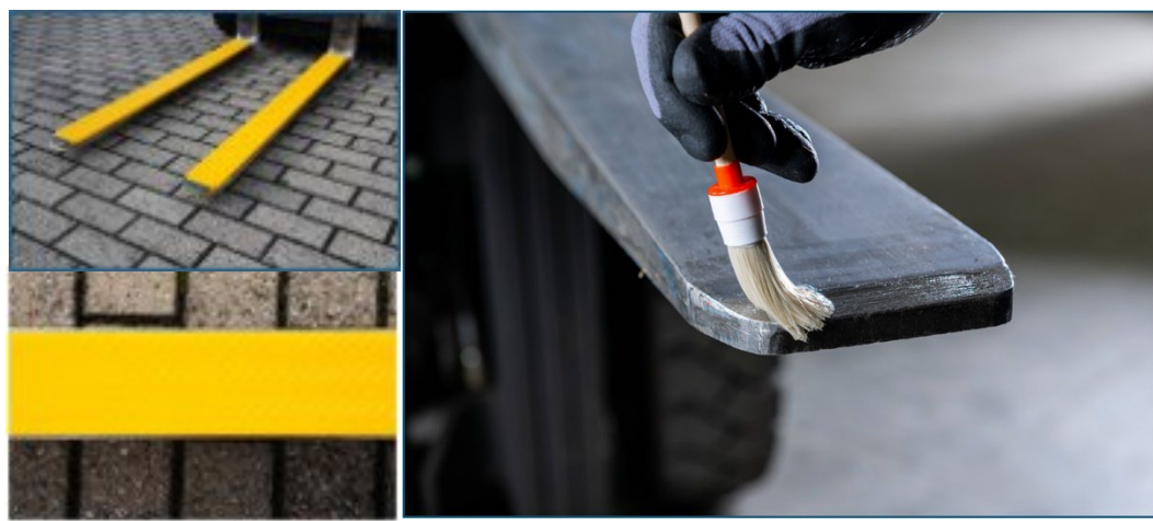
様々なタイプのセキュパッド